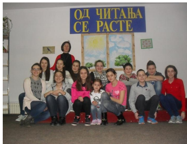
Слика 20. Са приредбе