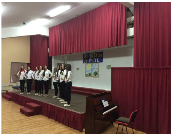
Слика 17. Са приредбе