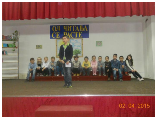
Слика 14. Са приредбе