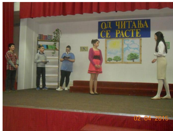
Слика 18. Са приредбе