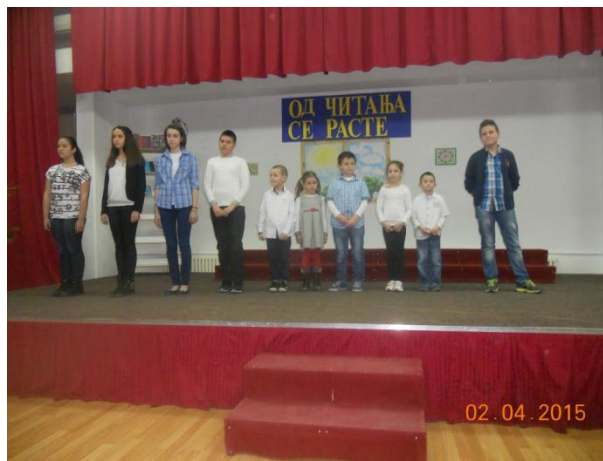
Слика 16. Са приредбе