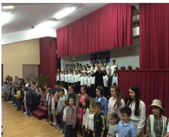
Слика 19. Са приредбе