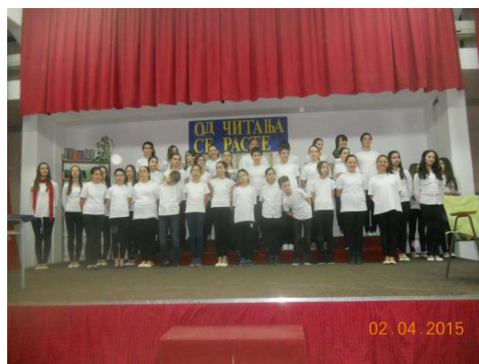
Слика 12. Извођење хора