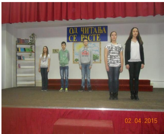
Слика 15. Са приредбе