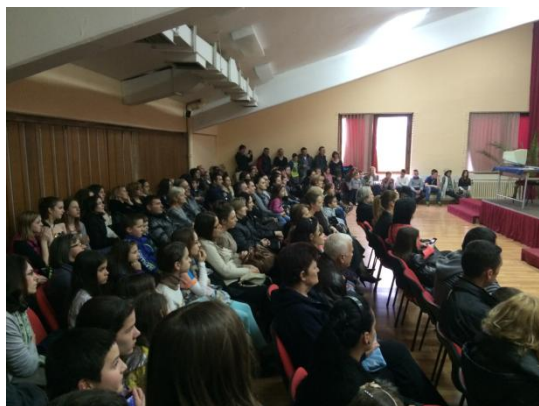
Слика 11. Публика на приредби

„УВЕК МОЖЕМО ВИШЕ ОД ОНОГА КОЛИКО МИСЛИМО ДА МОЖЕМО“