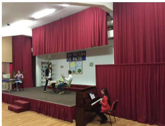
Слика 13. Са приредбе