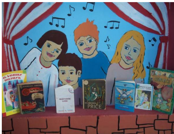
Слика 21. Из „Плаве собе“

Ученици са потешкоћама осјећали су се прихваћено, јер смо објаснили да ће њихову „Плаву собу“ користити сви ученици зависно од потреба часа и креативности учитеља и наставника.