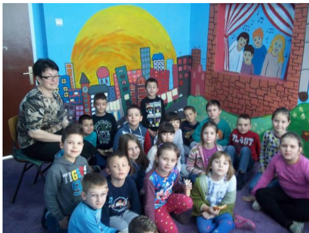
Слика 23. Из „Плаве себе“