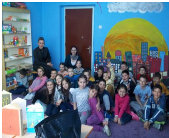
Слика 22. Из „Плаве собе“