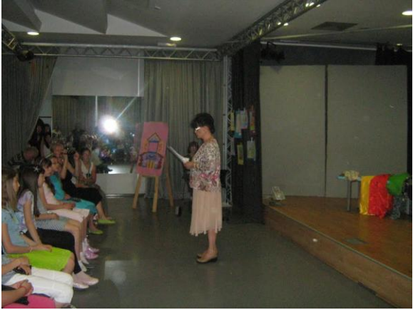
Слика 26. „Уђи бајку“