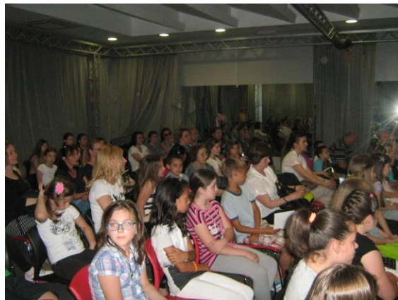
Слика 25. „Уђи у бајку“