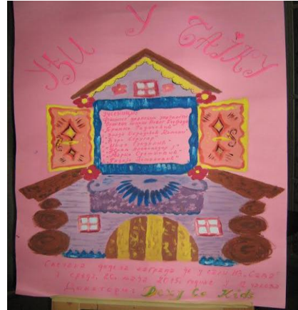
Слика 27. „Уђи у бајку“