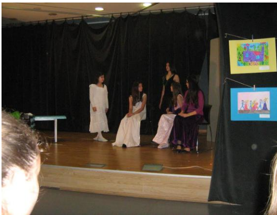
Слика 24. „Уђи у бајку“

Уз обећање школских библиотекара да ће и наредне године бити нових и корисних збивања, потврдила се снага добре, енергије која се све више и упркос свему шири: у давању је награда. Дајући другима радост и срећу и сами бивамо њима испуњени. Тако смо, улазећи у ову новобеоградску бајку, постали њен део.