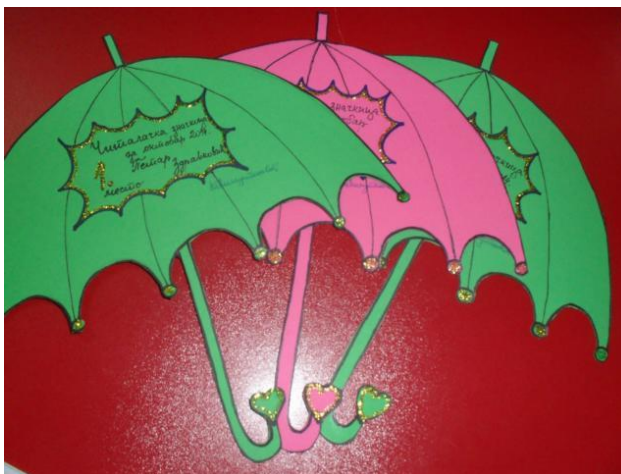
Слика 3. Читалачка значкица

Акција и данас опстаје, у њој учествује највише првака и другака, док су трећаци развили навику сталног читања, па сада учествују у пројектима као што су Читалићи и Оштро Перце . Ова два пројекта унела су у нашу школу нову енергију, изазов и тимски дух. Сматрам да су акције овог типа продуктивне јер дају резултате. То видим и по томе што су самоиницијативно организовали два продајна вашара на којима су сакупили новац за куповину нових књига. Наравно, књиге које смо купили нису лектире, него су актуелне и њима занимљиве. Потрудила сам се да то буду књиге о авантурама, али и о љубавима, за мало старије ђаке.