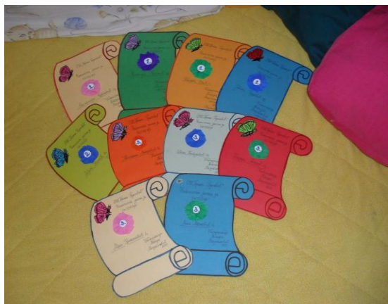
Слика 1. Читалачка значкица

Друга акција коју спроводимо од прошлог септембра је Читалачка значкица , акција на месечном нивоу, намењена, пре свега, ученицима млађих разреда. Као творац читалачке значкице, у могућности сам да индиректно утичем на читалачки избор ученика. Идеја је да када ученик дође да позајми књигу, својим препорукама сугеришем који наслов би могао да узме. Настојим да прваке најпре упутим на сликовнице, затим на све књиге, које су редовна лектира, а потом и на оне које превазилазе оквир редовне лектире. Трудећи се да освоје значку, која је сваки пут другачија, ученици пристају на све моје сугестије. Наравно, морам водити рачуна о томе на ком нивоу је њихово читање како не бих погрешном сугестијом прекинула њихову жељу за читањем, коју покреће и жеља за идејно лепо осмишљеном значкицом.