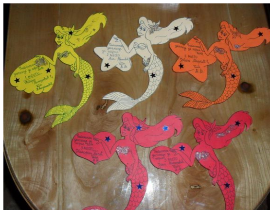
Слика 2. Читалачка значкица

После неколико месеци спровођења акције Значкица , приметили смо да све више ђака жели да чита – вероватно их је покренула жеља да освоје Значкицу . Што се самих значкица тиче, једноставно је направити их: потребно је само да прелистате неке од креативних страна на интернету и добићете идеју. Значкице нису ни скупе за прављење, правим их од хамера у боји, украшавам маркерима и лепком са шљокицама. Оно о чему водим рачуна јесте да за девојчице буду у розе, црвеној, љубичастој или наранџастој боји, а за дечаке су зелене и плаве. Схватила сам да их то веома привлачи па сам наставила да им правим различите значке.