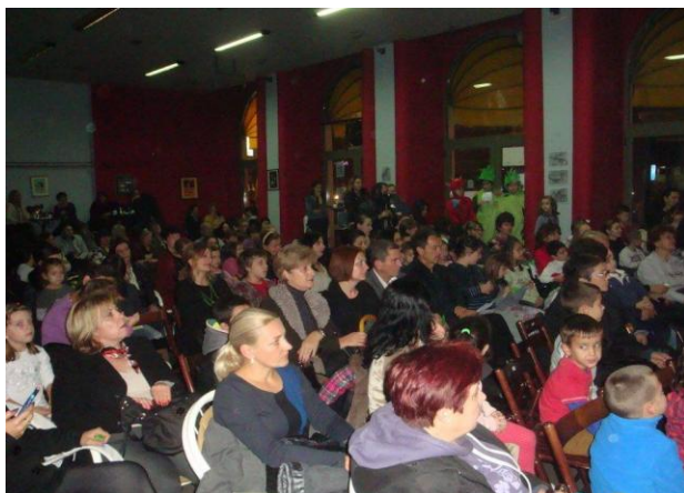
Слике 6. и 7. Детаљи са представљања Змајевитог времена у КЦК „Крушевац“

Аниматор, филмофил, рекламождер, писац – ни слутила нисам шта ћу све постати као школски библиотекар, али вреди!