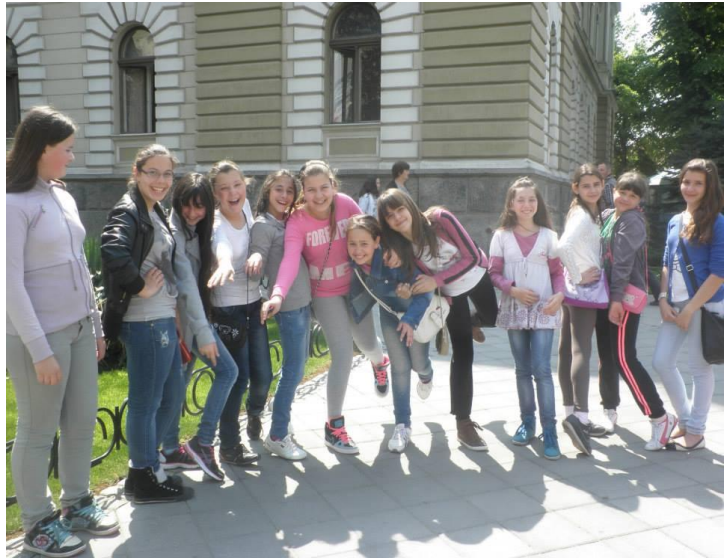
Слика 3. и 4. Чланови библиотекарске секције у акцији, Галерија Крушевац

Често доносим у школу савременије наслове из своје кућне библиотеке. Понекад су то књиге које они желе да читају, често оно што ја сматрам да би им било корисно и занимљиво. И – ово је заиста успешно! Ученицима импонује да прочитају оно што је мој лични избор, да буду први који ће ту књигу прочитати, тако се јављају и теме за разговор које су само „наше“.