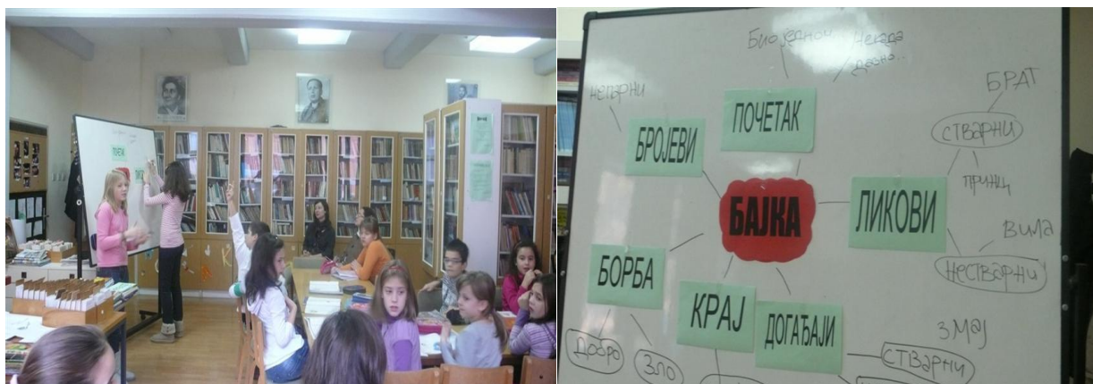
Слика 2. Мапа ума Одлике бајке

У овој фази посебно бих истакла прва два часа тематске наставе када се обрађивала народна бајка „Чардак ни на небу ни на земљи“, на којима су ученици, кроз вршњачку едукацију поновили одлике бајке правећи заједничку мапу ума. Након завршене анализе бајке, ученици су правили мапу ума бајке “Чардак ни на небу ни на земљи“ која је од њих захтевала логичко разумевање и организацију информација, односно да повезују и интерпретирају информације. Вршњачка едукација, учење на асоцијативан начин и мултимедијални садржаји на овим часовима су веома мотивисали ученике за даљи рад. Тог дана одржан је и час енглеског језика на коме су ученици поновили одлике бајке, именовали неке бајке на енглеском, гледали цртани филм „Златокоса“ и читали бајку по улогама.