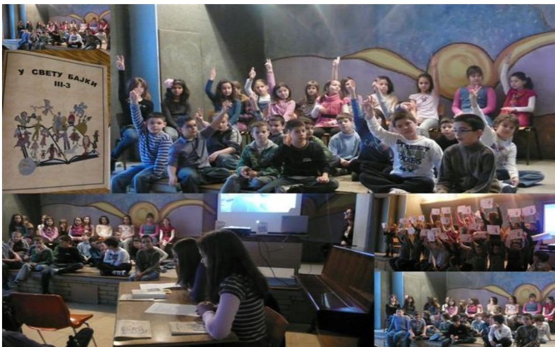
Слика 4. Промоција књиге „У свету бајки“

Током евалуације видело се колико су ученици усвојили знања о одликама бајки, посебно су истакли групни облик рада, асоцијацију и остале пп презентације које су се користиле у раду. Поједини ученици су причали шта им је било тешко и где су тражили нашу помоћ.