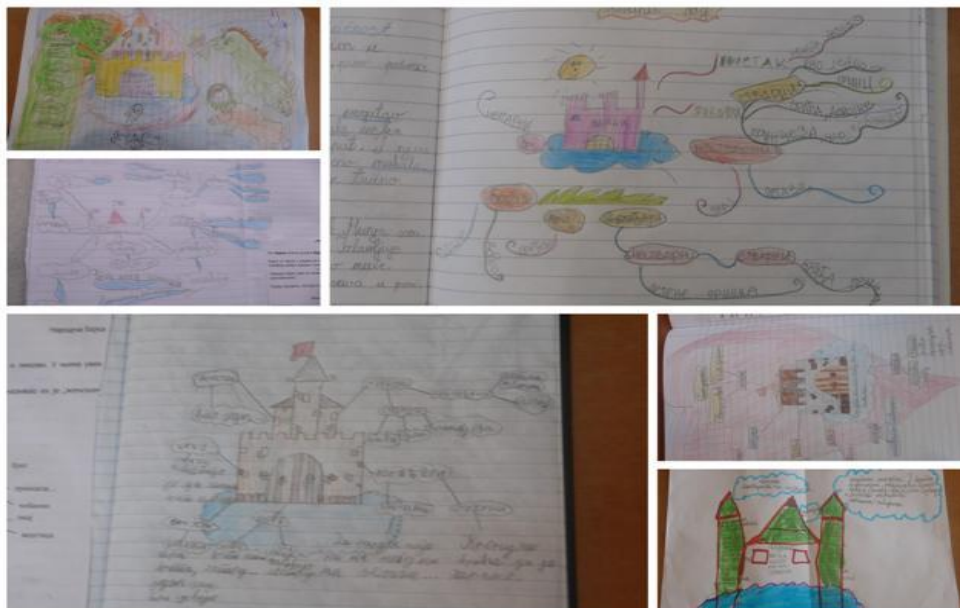
Слика 3. Мапе ума Чардак ни на небу ни на земљи

Другог дана ученици су кроз групни облик рада обрадили лектуру „Бајке“ Браће Грим. На часу математике ученици су решавали наставни листић „Мачак у чизмама“, рачунске приче. Текстуални задаци у наставном листићу „Мачак у чизмама“ повезани су са догађајима и ликовима из бајке „Мачак у чизмама“ и на тај начин је ова наставна јединица интегрисана у тематску наставу.